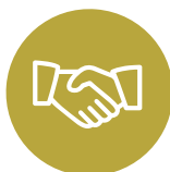
Σεβασμός και Ακεραιότητα