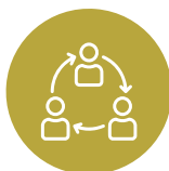
Κοινωνική Ευθύνη και «Υπεύθυνο Παιχνίδι»