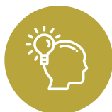
Συνεργασία και πρωτοβουλία