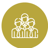
Επαγγελματισμός και Υπευθυνότητα